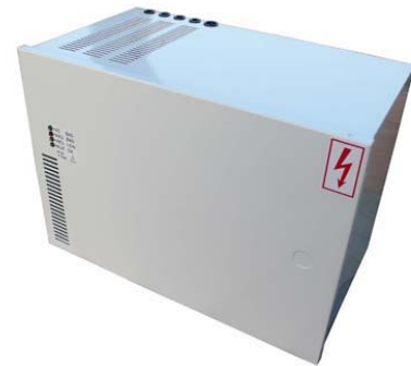
PZD13 připojení svorek